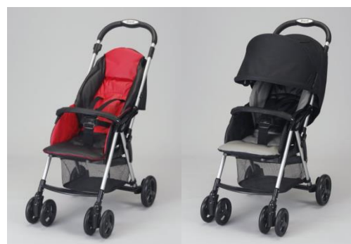
Combi 施設用ベビーカーSC51 2014年キッズデザイン賞受賞製品